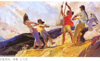
冷暖对比：乔奇 三文鱼