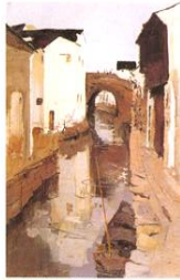
复色协调法：曹廷毅 吴冠中